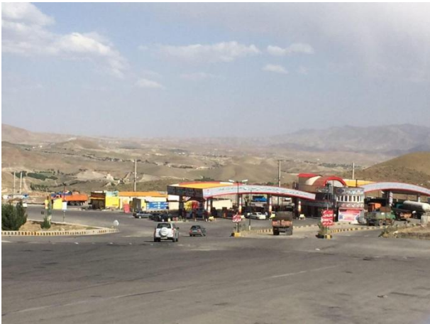
شکل (۱): مجتمع خدماتی- رفاهی بین جاده‌ای.

در زمان بحران‌های امنیتی، نقش مراکز خدماتی- رفاهی بین جاده‌ای (شکل (۱)) بسیار حائز اهمیت است. این نقش هنگامی به اوج خود می‌رسد که وضعیت تدافعی برای کشور در اولویت باشد. در این شرایط، علاوه بر نقش مراکز خدماتی- رفاهی بین جاده‌ای به‌عنوان جان‌پناه و پناهگاه مناسب به‌منظور اسکان اضطراری مسافران بین راه؛ قابلیت این مجتمع‌ها برای تغییر عملکرد به پایگاه نظامی، پادگان و یا استفاده‌های پشتیبانی مانند دفتر فرماندهی، مکانی برای درمان مجروحان جنگی، انبار مهمات و آذوقه یا حتی مکانی برای ارائه خدمات به سربازان عازم یا برگشته از مناطق جنگی؛ بر اهمیت مکان‌یابی چنین مراکزی می‌افزاید [۵]. از این رو، با توجه به معرفی جایگاه مجتمع‌های خدماتی- رفاهی و توانایی عملکرد آن‌ها در زمان بحران‌های غیرامنیتی و امنیتی، نیاز است در احداث این مجتمع‌ها، تمهیدات پدافند غیرعامل هم در نظر گرفته شود که در این پژوهش بررسی می‌گردد.